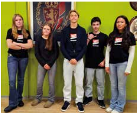
De unge MOTivatorene som ble skolert i Flå.