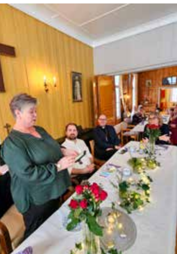
Avslutningsord fra menighetsrådsleder.