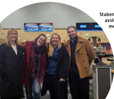
Staben hadde avslutning med bowling.

Gaver og fine ord som var så innmari fortjent. Takknemlig for alt han har bidratt med og gitt bygda, menighet og ansatte i Flå Sokn.