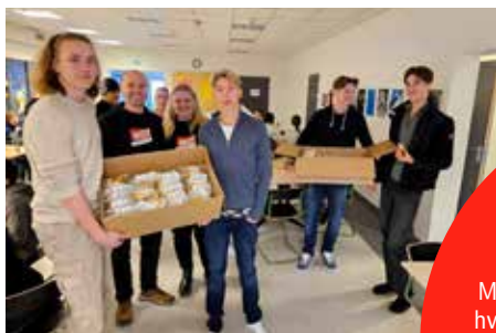
Utdeling av skolebrød fra Skue Sparebank.

Ungdomsskoleelever ble møtt med fersk vaffel, bålpanne, varm saft, brødskiver og pepperkaker til hele skolen i skolegården ved personale og miljøarbeidere psykisk helse barn og unge, aktiviteter med ungdomsskolen, kort, drops, skolebrød fra Skue Sparebank, som stiller opp hvert år. Lommelykter sponset av Flå Spareforening som påminnelse om å lyse på det positive med hverandre og det som skjer rundt oss i hverdagen, samt kåring gledesspreder blant ungdommene og ungdommer som kåret en i personalet. Vaffel på veksthuset med god hjelp av presten vår Vetle, besøk i barnehagen med kort og baller til barna, drops, kort og lommelykter til personalet der. Og innom Flåheimen med drops og kort der. Takk til alle som bidro med å glede masse denne dagen.