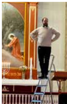
Vetle på skolegudstjenesten.