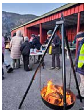
VENSTRE: Elevene ble møtt med varm drikke, brødskiver og bålpanne på morran.