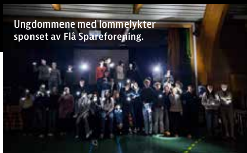
Ungdommene med lommelykter sponset av Flå Spareforening.