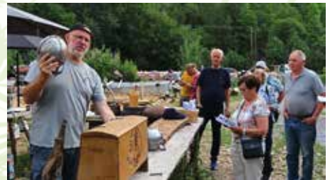
Wergeland med kopi av vikinghjelm