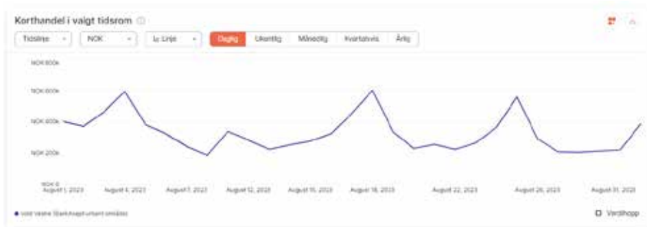
Bildet viser korthandel i august, hvor vi ser tydelig hvordan «Hans» og stenging av Rv7 påvirker resultatet.