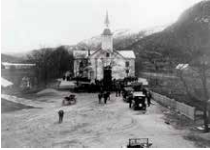
Her er bilene kommet på Kirkepallen, og mer av kirken er blitt malt. Her er de mørke detaljene og etasjeskiltene overmalt.

fargesettingen som ble brukt i sveitserstilen, med mørke vindusrammer og lysere gerikter og detaljer.