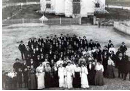
Dette bilde fra 1912-17 (over). Antagelig 1914. Her er noen av fargene blitt lysere.