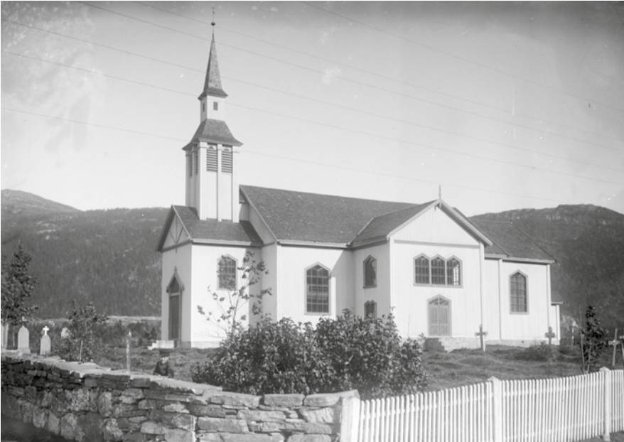
Slik så kirka ut da det nye malearbeidet fullført. (Årstallet er usikkert men ca rundt 1930)