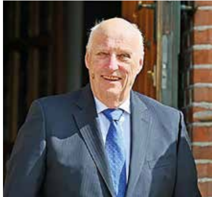
Hans Majestet Kongen.