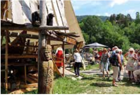
Historielags tur- Gruppen ved vikingsskipet.