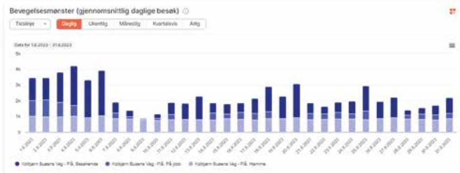
Bildet viser bevegelsesmønsteret i august. Nederst på stolpene er de som bor i Flå sentrum, den midterste er de som jobber her og øverst er de som besøker området. Her ser vi også tydelig hvor viktig Rv7 er for sentrumet vårt.