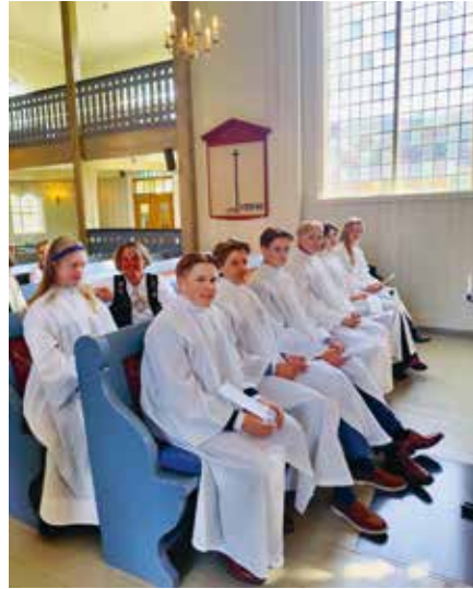
Spente konfirmanter rett før konfirmasjonsgudstjeneste startet.

Nok et konfirmasjonsår er over og konfirmanterne leverte både på samtalegudstjenesten og i konfirmasjonen. En flott bukett med konfirmanter. Fin preken og