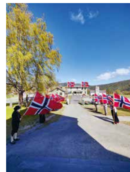
Flaggborgen med ungdommer som tok imot folket til 17. mai gudstjeneste.