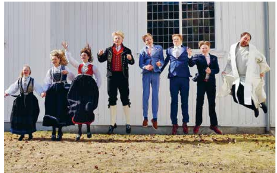
Hoppende glade konfirmanter og prest etter samtalegudstjenesten.