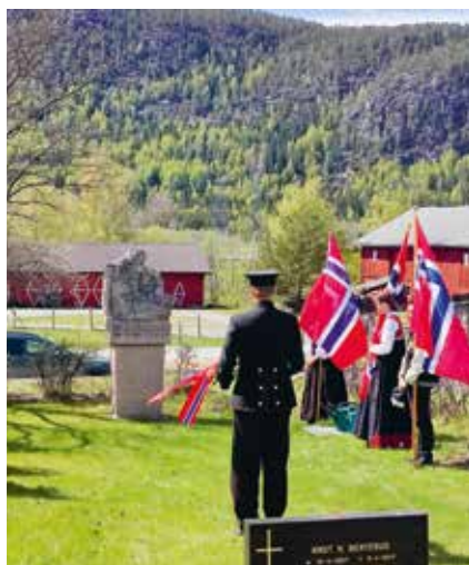
Kransenedleggelse ved minnestein ved kirken underveis i 17. mai toget.