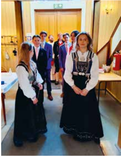
Spente konfirmanter i gangen samtalegudstjenesten.