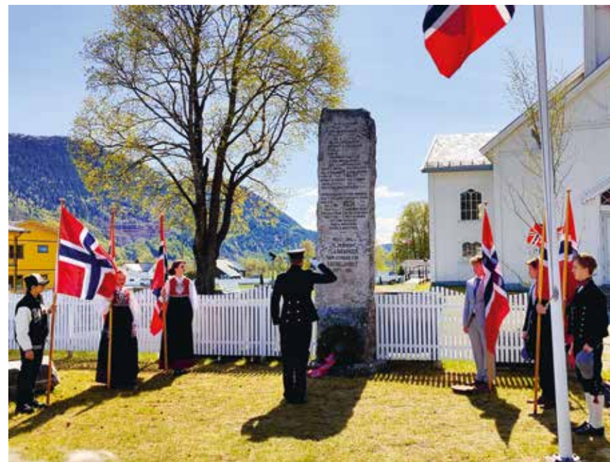
Kranspåleggelse uten for kirken etter gudstjeneste.