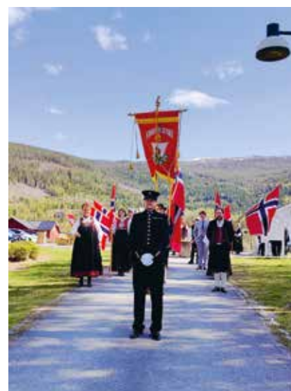
Oppstilling flaggborg fra kirke til veksthuset.