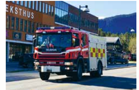
Brannmannskap var også på plass for å sikre trygt og godt 17. mai tog.