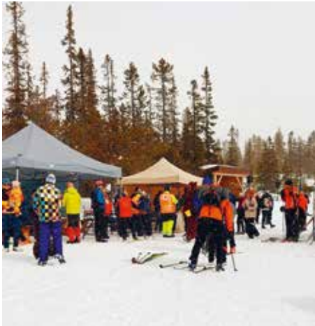
Bra oppmøte av folk!