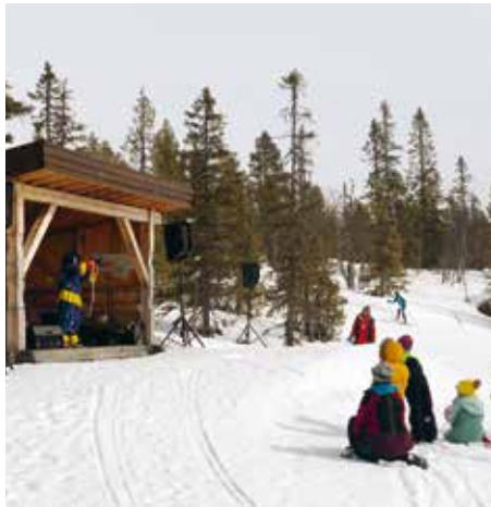
Klovnene Silja var populære blant barna.