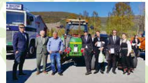
Bilparaden - Glade vinnere i kjøretøyparaden.