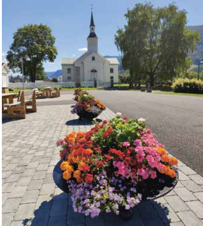
Kirkepallen i sin skjønneste prakt

i dialog med oss, slik at kirkegårdsarbeider blir informert/orientert.