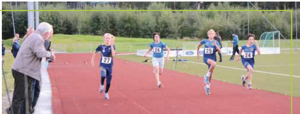
Raske gutter på 60 meter.

Fr iidrettsgruppa arrangerte åpent klubbmesterskap i friidrett på Flå stadion 5. september. I flott vær konkurrerte nærmere 20 av IL Flåværingens medlemmer sammen med ca. 10 utøvere fra andre klubber. Det var et tett program med både løpsøvelser, kulestøt, kast med liten ball, høyde, lengde og stavsprang.