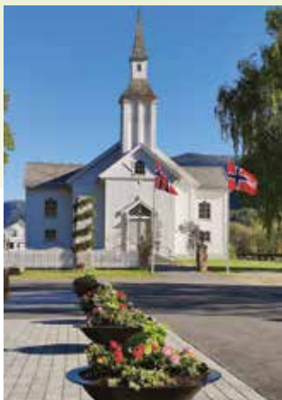
Pyntet til fest 17. mai.