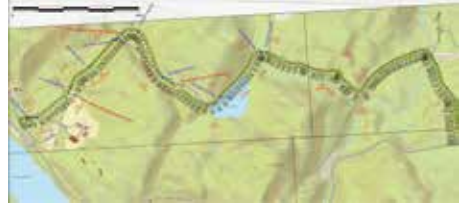
Kartutsnitt viser ny eksisterende og delvis ny vegtrase fra Bårdsplassen – Roppe. Strekning på ca. 2,5 km.

Bygging av ny og delvis oppgradering av eksisterende veg fra Bårdsplassen til Roppe er i gang. Det er Turhus Maskin AS fra Gol som har fått entreprisen. Vegen har en prislapp på ca. kr. 3,5 mill. Vegen er planlagt ferdig i løpet av desember 2022, og skal være helårsveg. Vegen bygges etter en skogsbilvegklasse 3. Det betyr at den får stigningsgrad på max 10%, og kurvatur slik at eksempelvis tømmerbil med firehjuls henger kan bruke vegen.