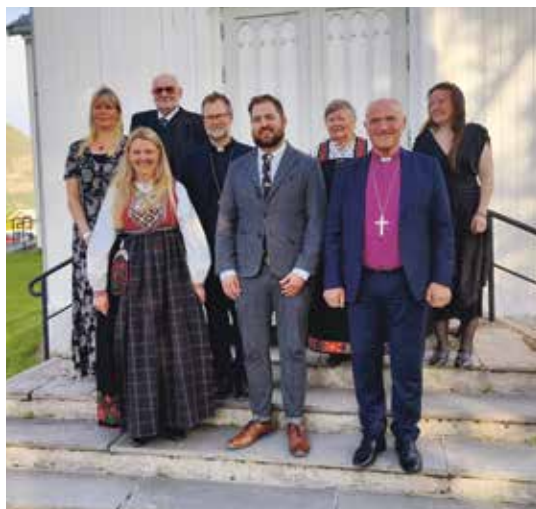
Under: Vetle med ansatte i staben i Flå sammen med biskop, prost og nestleder i menighetsrådet.