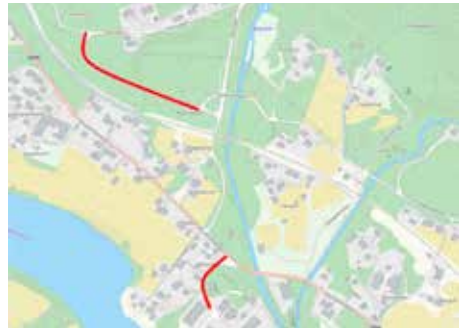
Strekninger med nye gatelys

Flå kommune holder på å gjennomføre oppsetting/utskifting av gatelys etter en tidligere godkjent plan. Etter denne planen skal det i høst monteres nye gatelysmaster på strekningen fra undergangen under Bergensbanen og frem til eksisterende gatelys på Heimoen byggefelt. I tillegg blir det satt opp nye gatelysmaster på en mindre strekning fra avkjøring Austsidevegen og ned til Industriområdet på Elvemo.