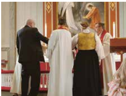
Over: Ferdig ordinert sokneprest og stola blir satt på av nestleder i rådet og prost.