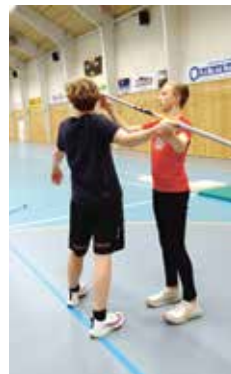
Trening på spydkast i Thonhallen.