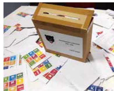
Åpning av «postkassen» med mange og gode innspill til planarbeidet.

Kommunedelplan for Flå tettsted er den «øverste» arealplanen for Flå sentrum og nærliggende områder både øst og vest for Hallingdalselva. Arbeidet med å vurdere konkrete forslag til arealbruk er i gang, og kommunestyret har overordnet jobbet med hvordan vi ønsker å utvikle flå tettsted. Flå kommune ønsker å jobbe for et levende sentrumsområde, gode boligområder for tettstedet og nødvendig areal til utvikling, samtidig som vi også har fokus på grøntområdene, omgivelsene og naturen rundt oss.