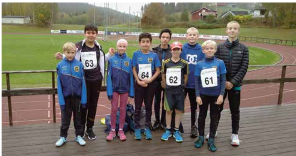
Gjengen samlet på stevne i høst.

Stevner er gøy, og det er stas at IL Flåværingen stiller med mange utøvere på start gang på gang. Fra i høst har vi vært på alt fra klubbstevne i Sigdal, til Norges største sprintstevne der også utøvere i verdenstoppen deltok. Flåværingen har jevnt over tatt med seg en rekke pallplasser og nye «pers'er», og vi har hatt det gøy og konkurrert sammen med deltakere fra mange andre klubber. Vi håper mange vil fortsette å være med på stevner!