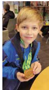
Risto samler pallplasser på stevner!