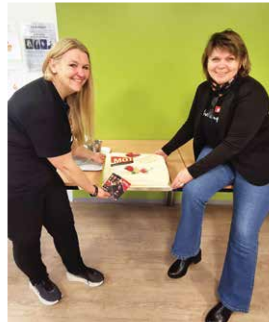
Ordfører og MOT koordinator.