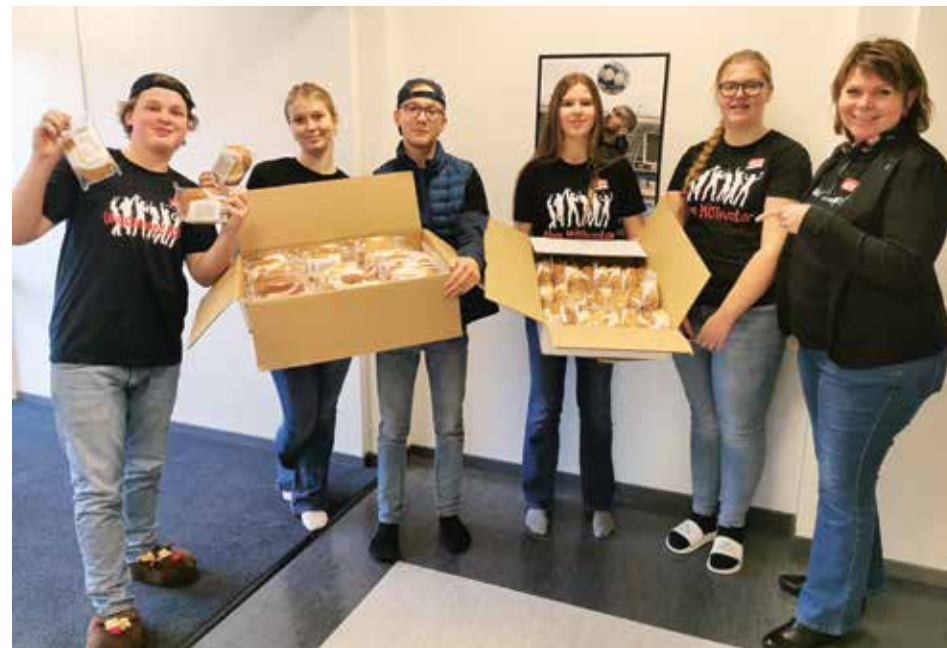
Ordfører med de unge MOTivatorene på MOT til å glede dagen.