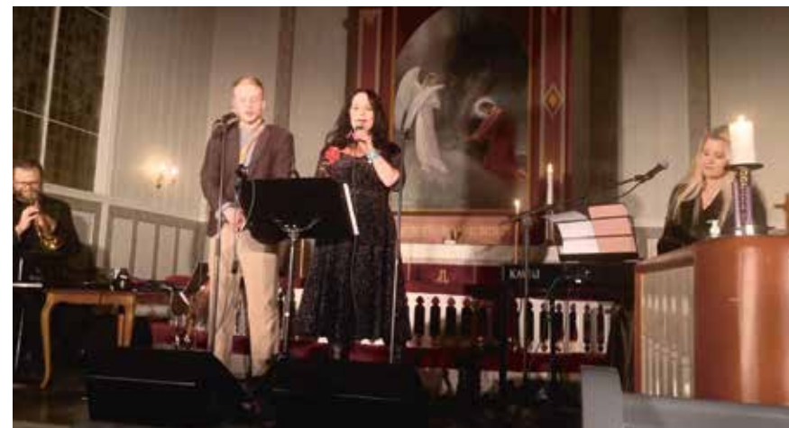
Julekonsert 11. desember hele gjengen.