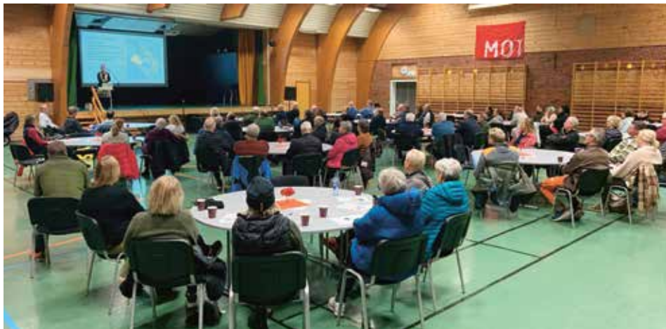
Godt oppmøte på åpent møte i Thonhallen før jul.