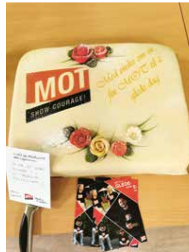
Kake med hilsen MOT til å glede.