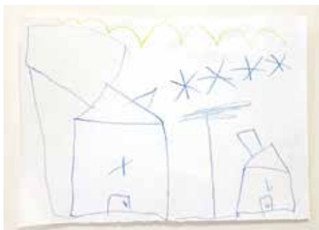
Barnetegninger er en del av innspillene til planarbeidet

Samfunnsdelen av kommuneplanen er kommunens viktigste plan, der vi skal stake ut kursen fram til 2034 og fastsette mål og strategier. Hvem vil vi være og hvordan vil vi ha det? Dette er de store spørsmålene, og vi er i gang med å svare på dette. Så langt så er det noen tema og mål som peker seg ut, og vi ser at det er bred enighet om mye. Vi ønsker å være en attraktiv og framoverlent kommune, med mye engasjement. Folketall er viktig for mange av våre mål, og videre er det blant annet livet vi