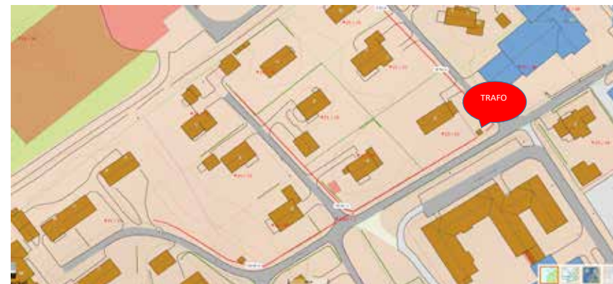
Ny Geggelysning i Vollsgutu, Snarvegen og Kolbjørn Buøens veg.