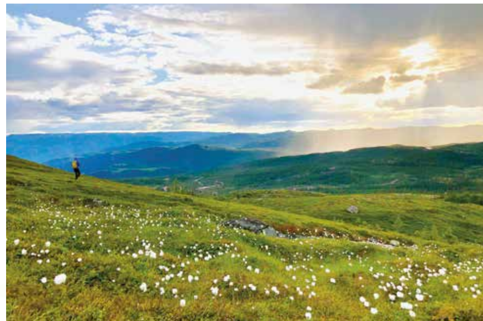
Kristnatten i fjor sommer.

Varm sommerklem fra gjengen på Turufjell