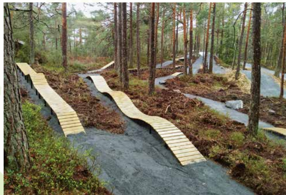
Eksempel på ferdighetsparken som kommer ved Slåttemyrrunden.