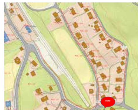
Ny Gatebelysning i Fururabben, Sørgardsvegen og deler av Flatsjøvegen. Strekninger samlet 818 meter. Rød strek på kart viser kabelgrøfter og plassering av hvilken side gatelysene kommer.