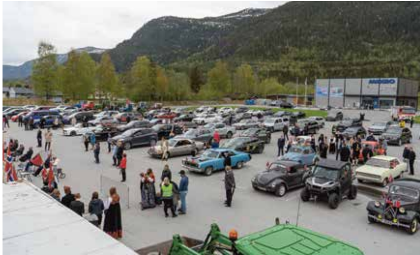
Festplassen oppstilling scene, foto Ragnar Hilde.