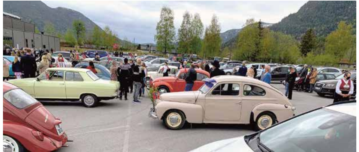
Festplass med folk ved biler og vennekoorter.