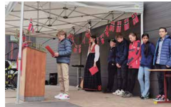
Tale 7. trinn.