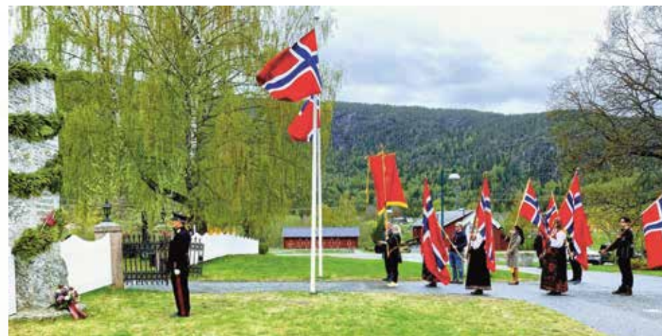
Flaggborg med kransenedleggelse bauta utenfor kirken.