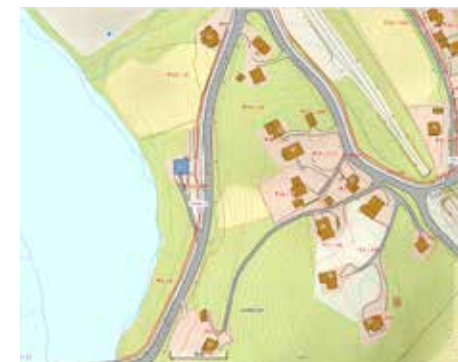
Ny Vegbelysning fra Østsiden av Flå bru, og frem til avkjøring Flatsjøvegen. Lengde 320 meter. Rød strek på kart viser kabelgrøft og hvilke side av vegen gatelysene kommer.