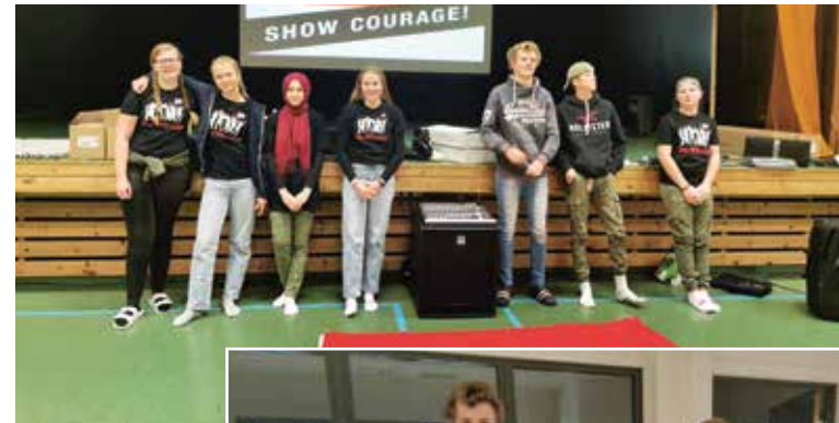
Over: Flott ungdom på MOT til å glede dagen.