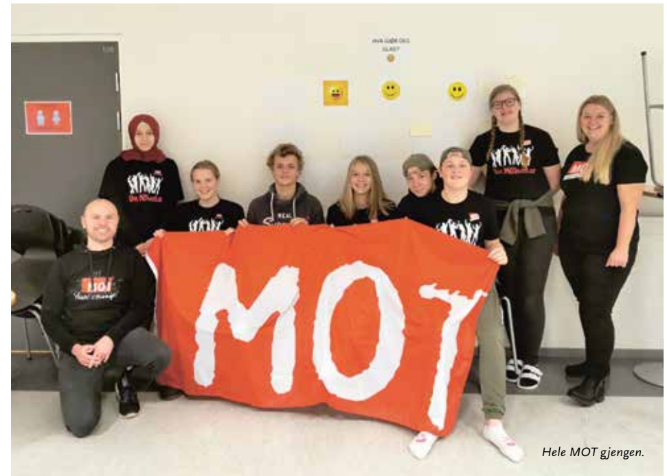
Hele MOT gjengen.