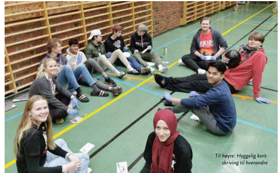
Til høyre: Hyggelig kortskrivning til hverandre