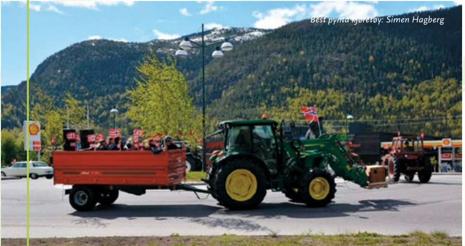
Best pynta kjøretøy: Simen Hagberg