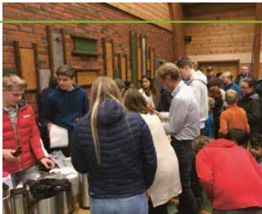
Tre fornøyde damer med hjerte for skole

Vi ønsker elever og lærere til lykke med ny arbeidsplass.