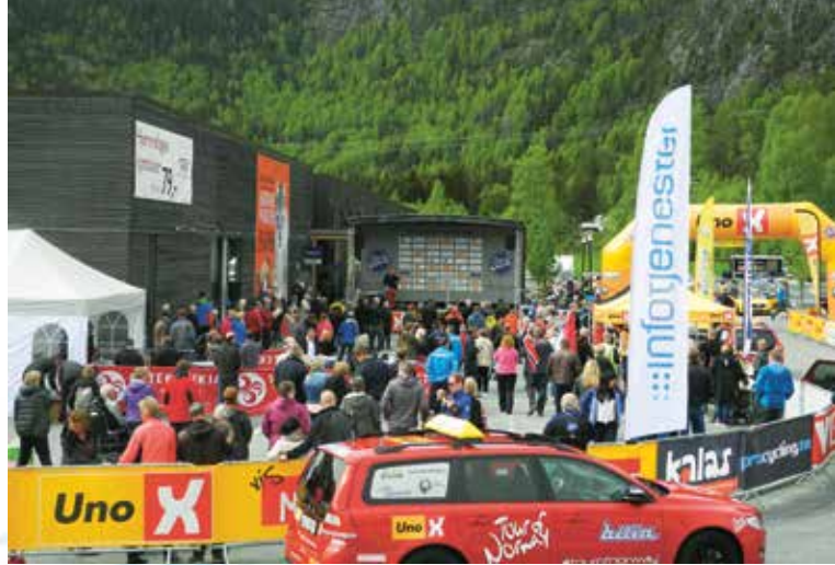
Tour of Norway