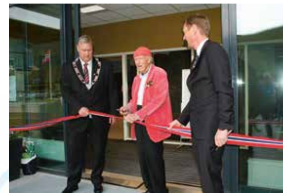
Åpning av Flå Veksthus