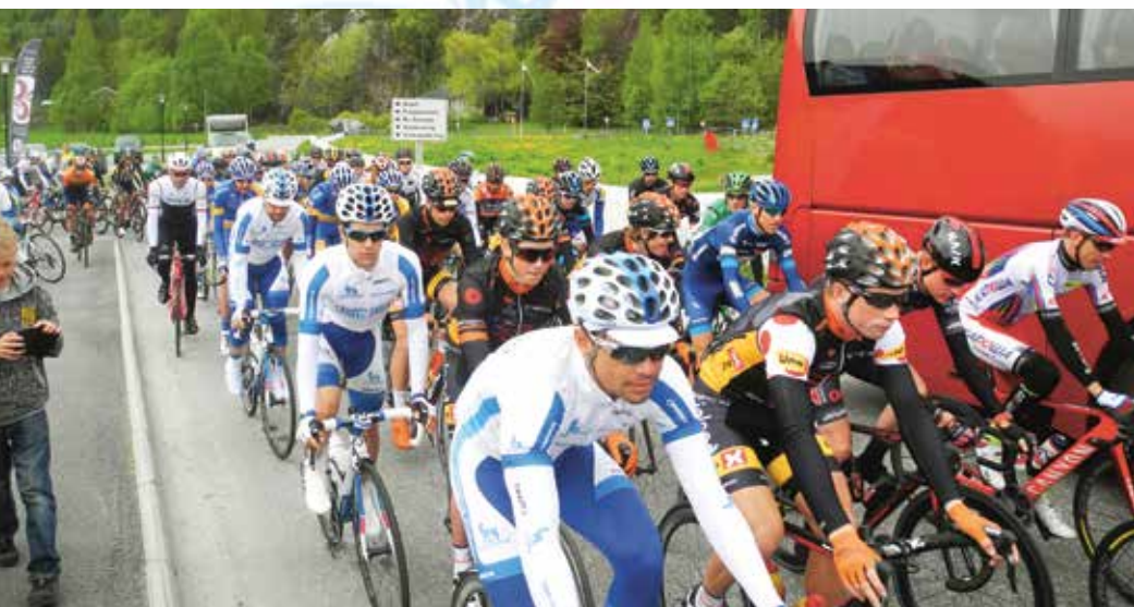
Tour of Norway