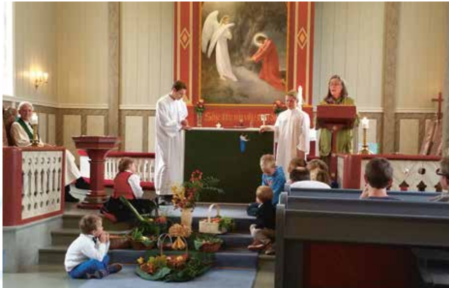
Barn som følger spent med på fortellingen.