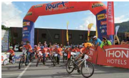
Fra fjorårets Tour of Norway for Kids.