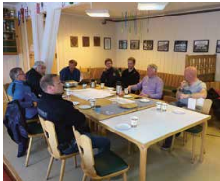
Oppstartmøte nytt Idrettsanlegg

Målet er at banen skal stå ferdig i løpet av 2017.