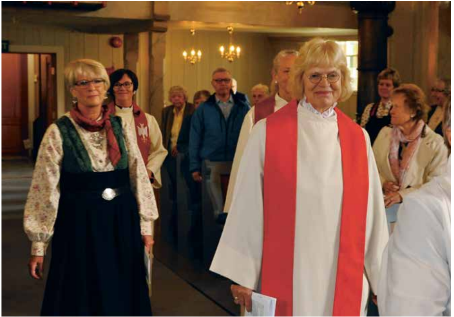
Fra innsettelsesgudstjenesten 29. juni 2014